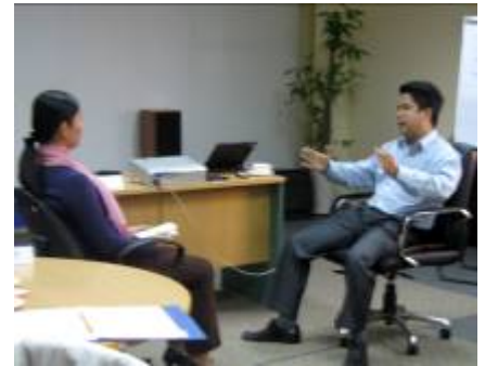
Rèn luyện kỹ năng thông qua các bài tập ứng dụng ngay trên lớp học

SAU: Bao gồm Giai đoạn ứng dụng vào thực tế và Giai đoạn