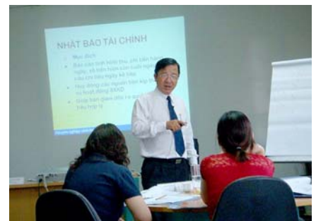
Giảng viên tâm huyết chia sẻ kinh nghiệm thực tế với học viên