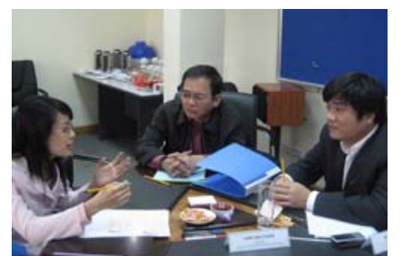
Thảo luận chuyên sâu trong nhóm – tìm giải pháp khả thi trước thách thức của thị trường và trả lời câu hỏi của việc phát triển kinh doanh.