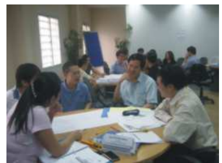
Trao đổi, thảo luận cùng giải quyết khúc mắc trong thực tế